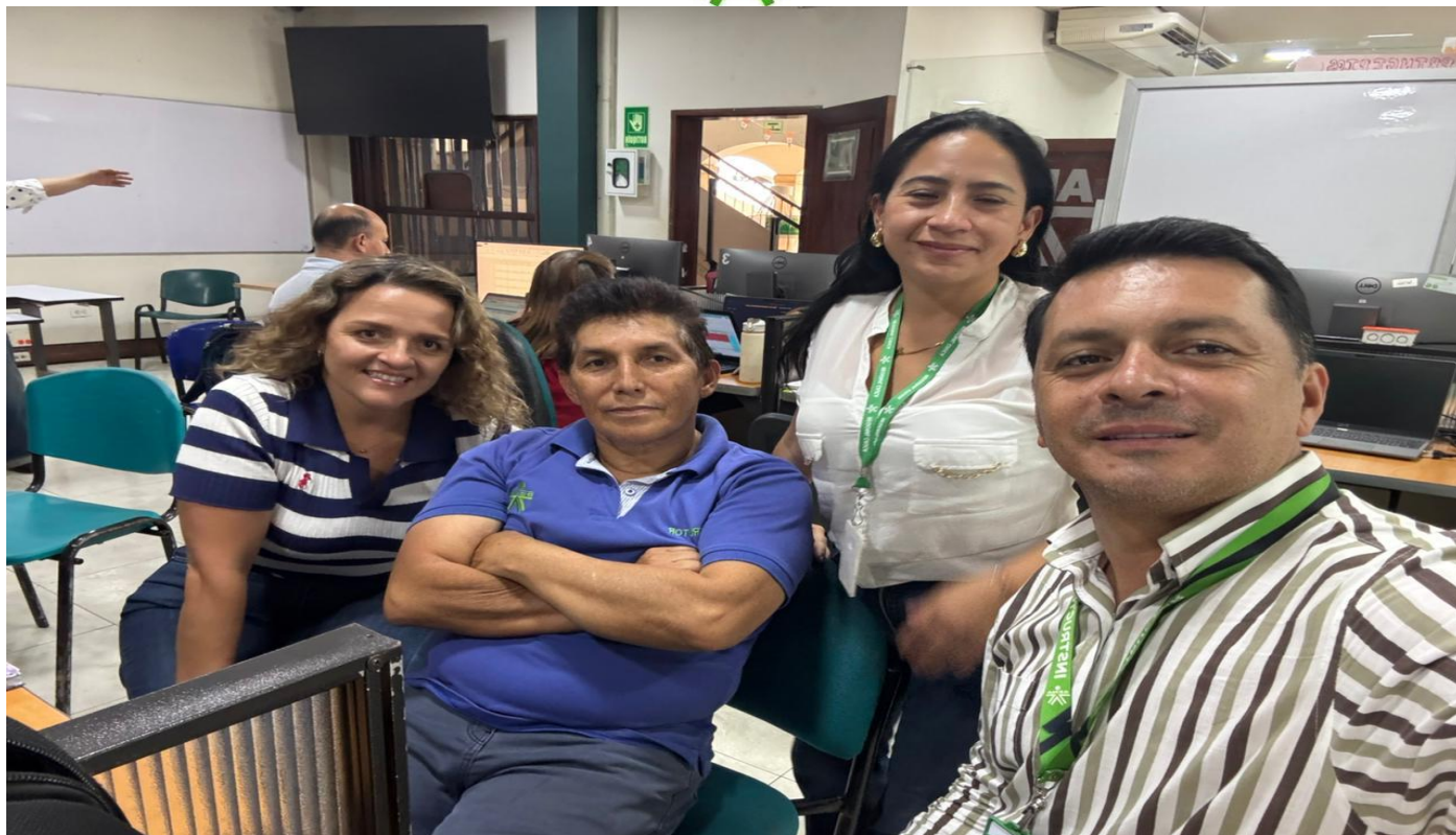
REUNION EQUIPO EJECUTOR - SEDE CUT 21-05-2026